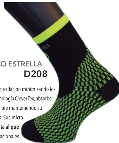
MODELO ESTRELLA D208

Telefono: 973 736 086 Email: ventas@medilast-sport.com web: www.medilast-sport.com